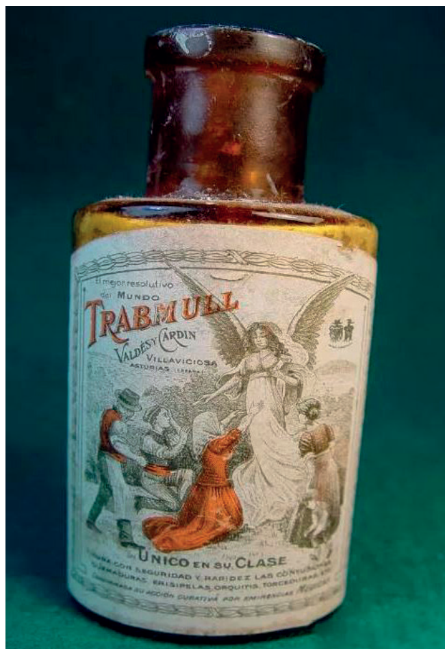
FIGURA 2. Flascó del resolutive Trabmull de Laboratorios Valdés-Cardín, de Villaviciosa (ca. 1909)

El prospecte que portava el medicament explicava les seves propietats 1 : “El Trabmull obra por sus propiedades isquemiantes, analgésicas, antitérmicas y antisépticas. Como todas las inflamaciones se caracterizan en un principio por un aumento de sangre, en el sitio donde están localizadas, por calor, dolor, etc., la manera de obrar del Trabmull es reducir este exceso de sangre a su cantidad normal por su propiedad isquemiante, quitando así el elemento sostenedor de la inflamación, haciendo desaparecer el dolor y demás síntomas por sus propiedades analgésica y antitérmica, y por su cualidad altamente antiséptica destruye los gérmenes productores de la inflamación, en unos casos, y evita su desarrollo en otros, estando por lo tanto, indicado el Trabmull en todas las inflamaciones externas, cualquiera que sea la causa que las haya producido; Contusiones por fuertes que sean (golpes, caídas); Quemaduras de primer y de segundo grado; las escaldaduras curan completamente antes de 24 horas; Torceduras, Eri-