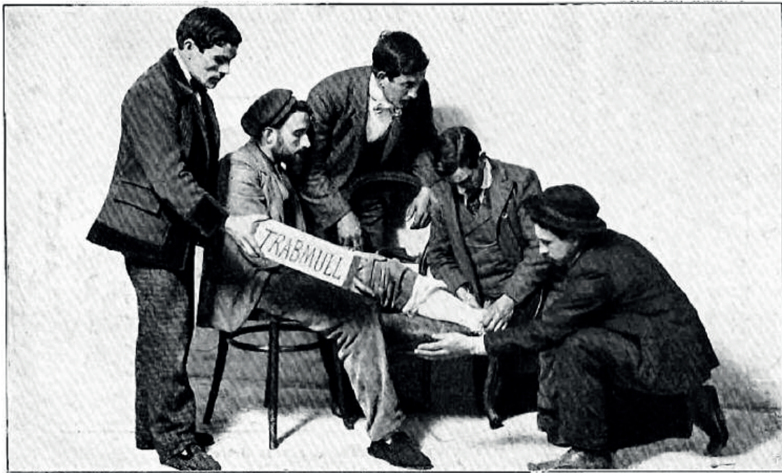
FIGURA 4. Postal publicitària que destaca l'eficàcia del Trabmull