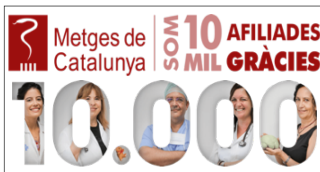
FIGURA 1. Imatge que celebra els 10.000 afiliats/des de Metges de Catalunya