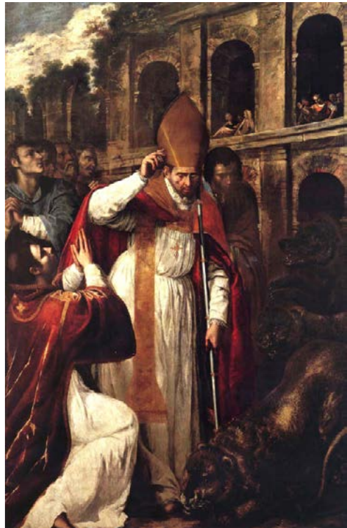
FIGURA 4. Martiri de sant Gener a l'amfiteatre de Pozzuoli, d'Artemisia Gentileschi, 1636 (Nàpols, Galleria Nazionale di Capodimonte)