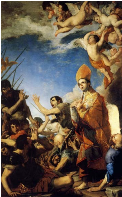
FIGURA 2. Sant Gener surt del forn sense cremar-se. Josep de Ribera, 1647. Museu de la catedral de Nàpols