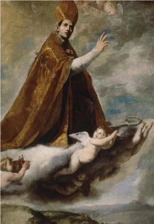
FIGURA 1. Sant Gener, de Josep de Ribera. Museu de la catedral de Nàpols