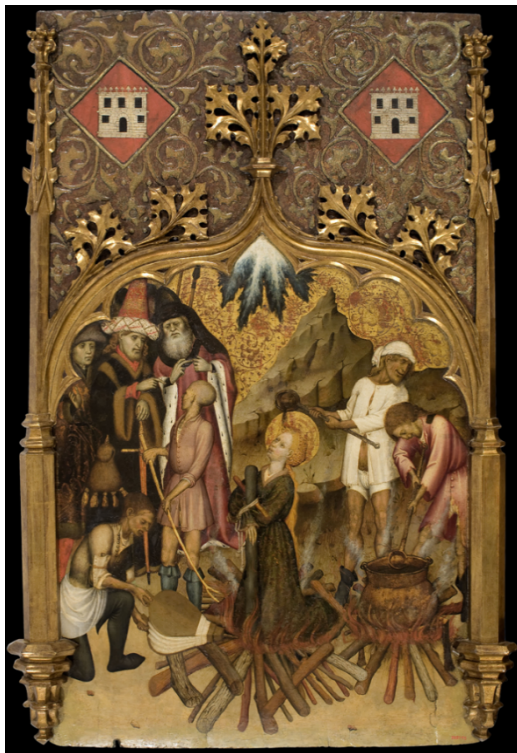
FIGURA 2. Martiri de santa Llúcia a la foguera. Bernat Martorell (1400-1452). Museu Nacional d'Art de Catalunya. Barcelona.