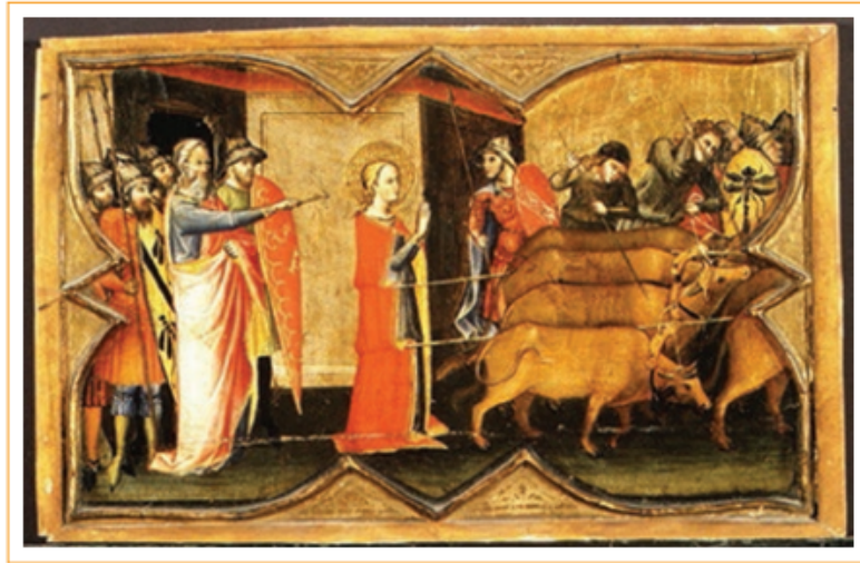
FIGURA 1. Santa Llúcia resistint els esforços dels bous per moure-la. Giovanni di Bartolomeo Cristiani (1340-1398). Museu Metropolità d'Art. Nova York