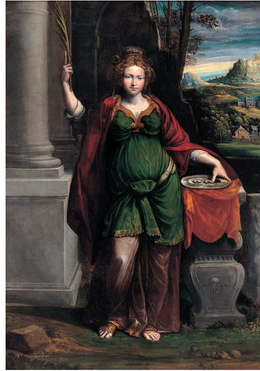
FIGURA 5. Santa Llúcia, obra de Benvenuto Tisi da Garofalo