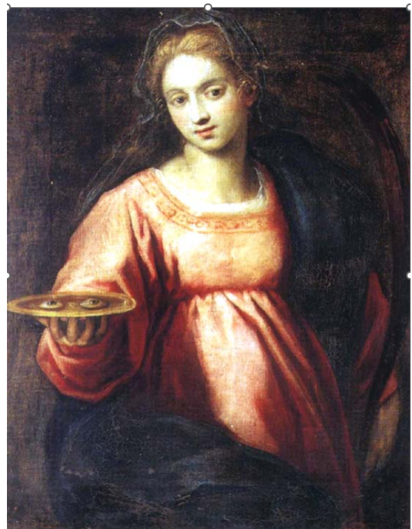
FIGURA 3. Santa Llúcia sosté una safata on es veuen els dos ulls que li han tret, però ella continua veient-hi (pintat per Jacopo Palma el jove, es conserva a l'església dels sants Jeremies i Llúcia, a Venècia)