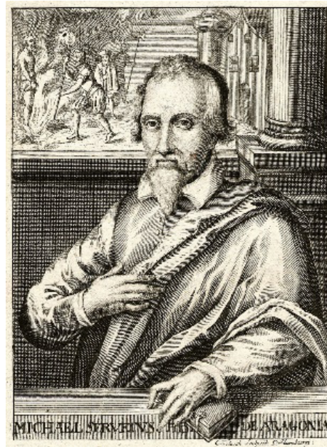
FIGURA 1. Miquel Servet Conesa

Des de molt prompte es va interessar pel misteri de la Trinitat, que va ser un dels temes principals de la seua obra. Amb només vint anys va publicar el seu primer llibre De Trinitatis erroribus (Els errors de la Trinitat), on explica que el dogma de la Santíssima Trinitat, consolidat en el concili de Nicea l'any 325, no té cap base bíblica. Servet considerava que Jesús era un home, fill de Déu, i negava l'existència de l'Esperit Sant, considerant que era la força de l'esperit de Déu. No entraré en discussions teològiques,