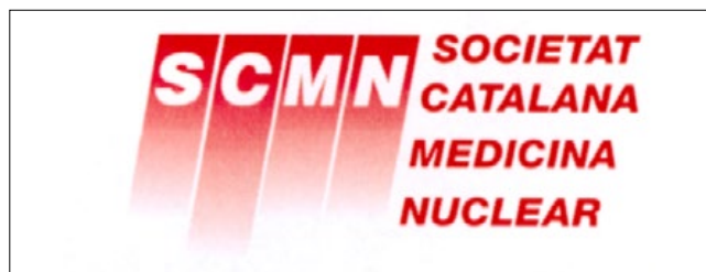
FIGURA 1. Primer logotip de Societat Catalana de Medicina Nuclear (1988)