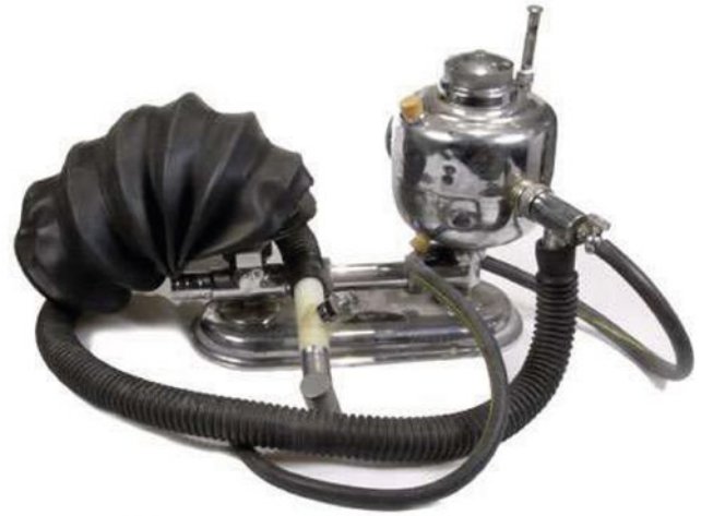
FIGURA 7. Exemplar de l'inhalador OMO, ideat per José Miguel, que s'emprà durant molts anys en els quiròfans espanyols

en la ventilació, així com les dificultats d'importació d'aparells estrangers, el van fer molt popular. Quan començà a abandonar-se l'èter, alguns autors inventaren dispositius i modificacions que permeteren emprar-lo amb halotà, però aviat fou superat per dispositius més moderns 8 .