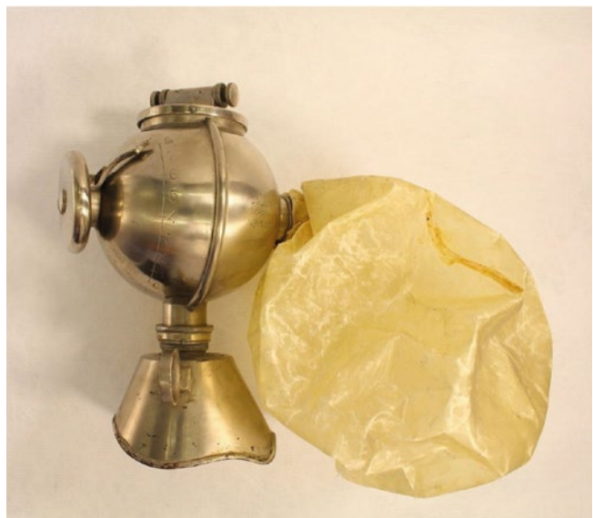
FIGURA 4. L'inhalador d'Ombrédanne (1907)

L'origen de l'inhalador prové de l'encàrrec que li va fer Charles Nélaton, el seu cap a l'Hôpital Saint Louis 14 . Després de dos accidents anestèsics amb cloroform, Nélaton va demanar a Ombrédanne que inventés un aparell per inhalar èter de forma segura. Com s'ha comentat prèviament, el seu ús havia decaïgut per la dificultat de dosifi-