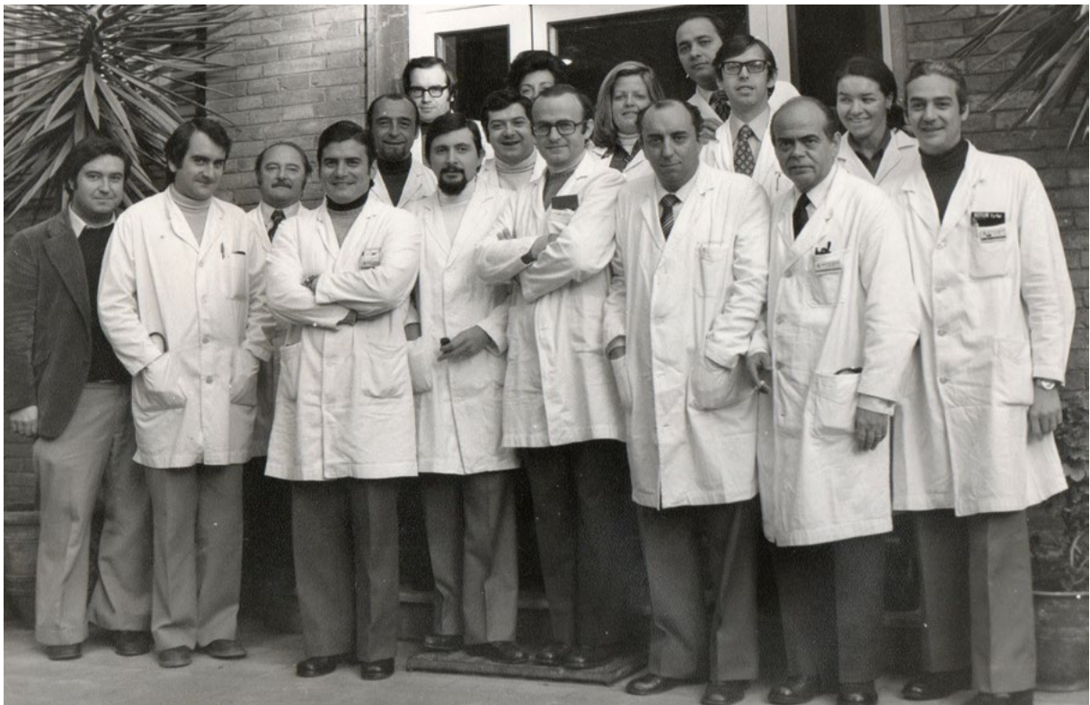
FIGURA 1. El Servei de Pneumologia de l'Hospital de la Santa Creu i Sant Pau, l'any 1975

Malgrat les decepcions, aquest canvi d'estratègia en la dedicació hospitalària de metges i infermeres va suposar l'inici d'un període que m'atreviria a definir com la “dècada prodigiosa de l'Hospital de la Santa Creu i Sant Pau”, en la qual va ser reconegut com un dels cinc millors hospitals d'Espanya. Alguns dels assoliments aconseguits en aquella dècada van tenir gran repercussió mediàtica com, per exemple, el primer trasplantament de medul·la òssia el 1976 i el primer trasplantament de cor amb supervivència perllongada el 1984. Però tots els serveis i unitats hospitalaris van col·laborar poc o molt a la consecució d'aquest reconeixement. El Servei de Pneumologia té una llarga experiència en aportacions pioneres; per exemple, la introducció al nostre país de la tècnica de la broncoscòpia el 1949, la creació d'un laboratori d'exploració funcional respiratòria el 1958, d'un departament de fisioteràpia respiratòria el 1962 i la docència de postgraduats mitjançant