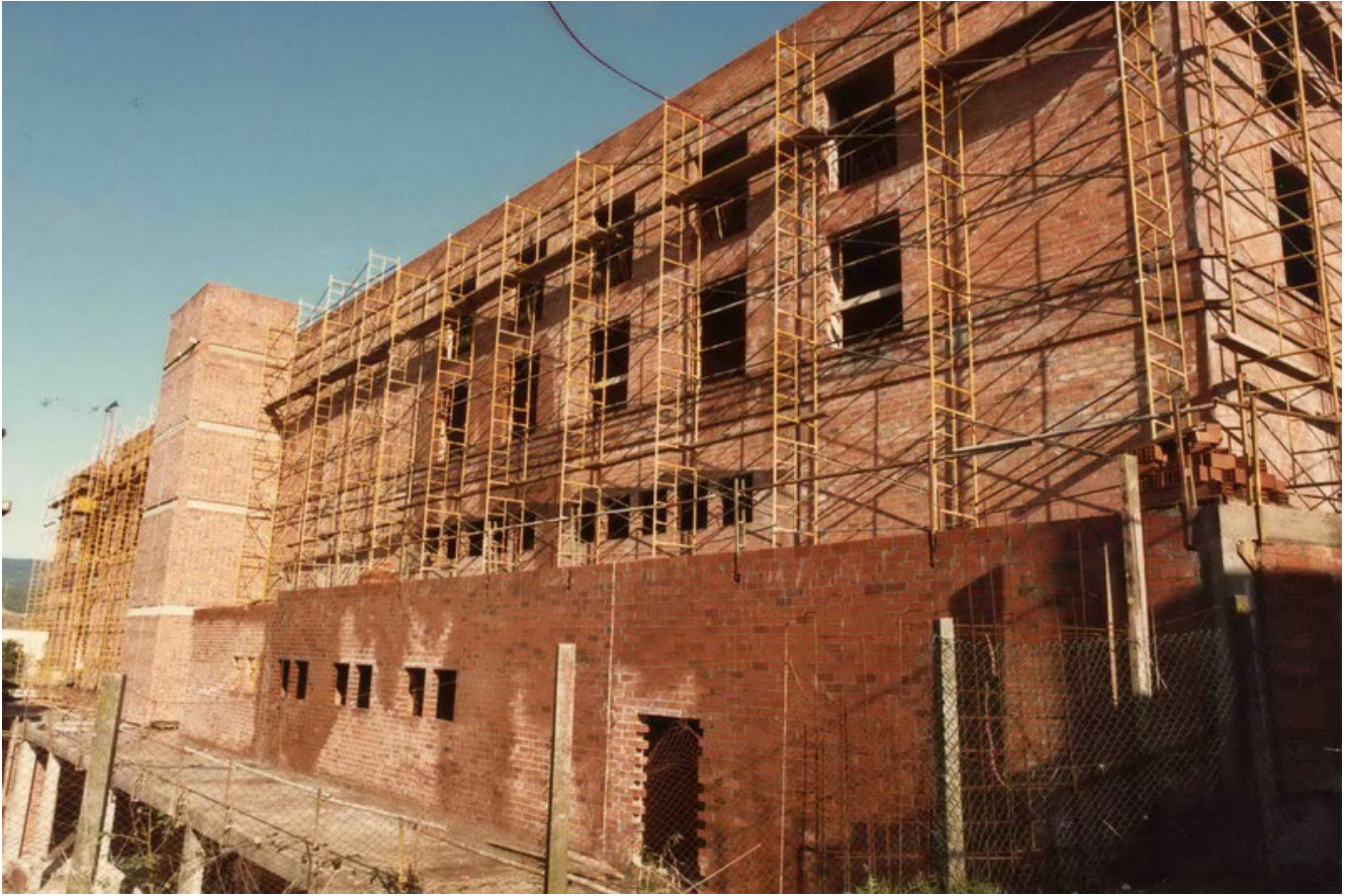
FIGURA 7. Obres de construcció de l'hospital l'any 1985

a tot Catalunya, apostant clarament pel de Palamós, amb l'objectiu d'aproximar l'assistència sanitària als ciutadans.