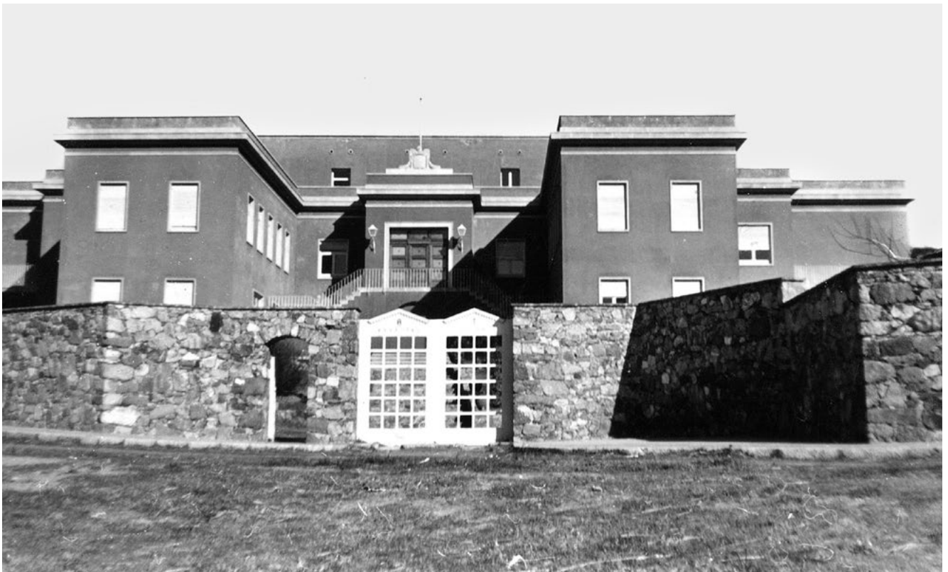
FIGURA 6. Fotografia del nou Hospital de Palamós de principis de la dècada de 1950