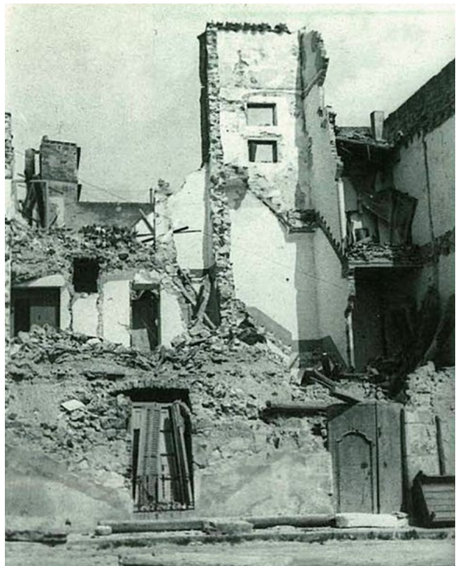
FIGURA 5. Aspecte que tenia l'Hospital de Palamós destruït, després del bombardeig de 1938

Es va arribar a un acord: l'Ajuntament havia d'adquirir els terrenys, que posaria a disposició de l'Estat, que s'encarregaria de sufragar les obres de l'edifici. Entre els anys 1947 i 1948 es va construir un nou bastiment amb una arquitectura racionalista. El 1950 es va fer el lliurament de la infraestructura al patronat de l'hospital. El centre sanitari va entrar en servei immediatament, tot i que no es va inaugurar oficialment fins el 1952.