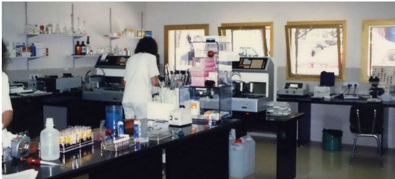
FIGURA 8. Laboratori de l'hospital (1988-1995)

El 2013, per tal de compensar els ingressos que es perdien per les retallades i potenciar una activitat privada que contribuís al sosteniment econòmic de l'hospital sense que interferís en la part assistencial pública del centre, es va crear la marca Hospital-Clínic Costa Brava per a captar turisme sanitari. Aquesta línia clínica estava a disposició dels residents a la zona, adreçada preferentment a clients estrangers, per oferir tot allò que no cobria la cartera pública 46 . Dins aquesta línia, el 24 de març de 2014 es va posar en marxa el Servei de Rendiment i Medicina Esportiva (SERME), com a servei integral de suport mèdic esportiu 47 (Figura 8).